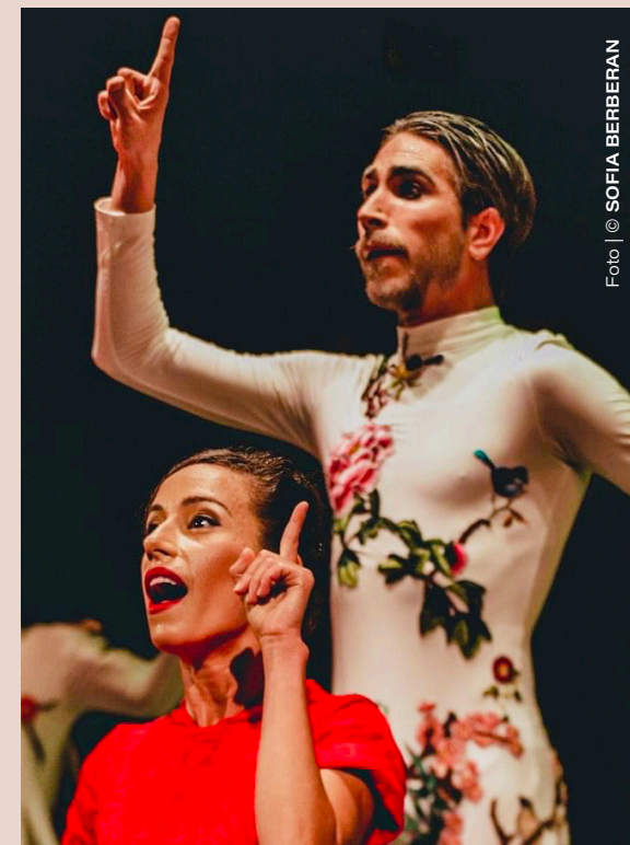
Theater for babies with Portuguese Sign Language.

Espectáculo apoiado pela DGARTES à criação e internacionalização.