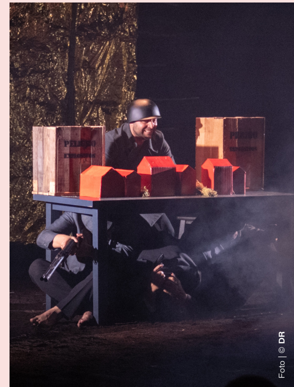
A play that portrays the takeover repression in Galicia, turning Cambedo into a village of refuge and rescue, in 1946.

Texto original e direção artística: Cândido Sobreiro | Interpretação: Alexandra Fernandes, André Sobreiro, António Esteves, Cândido Sobreiro, Estela Silva, Gilda Silva, Juliana Pereira, Miguel Sobreiro e Tiago Martins | Produção: Estela Silva | Sonoplastia e iluminação cénica: Matilde Esteves e Gonçalo Santos | Cenografia: coletivo Teatro de Balugas | Guarda-roupa: Estela Silva | Caracterização: Alexandra Fernandes | Cartaz e multimédia: André Sobreiro