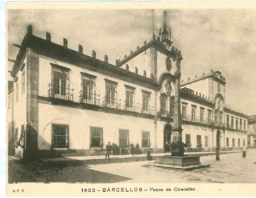
Ayuntamiento en 1903.

Se puede decir que la historia de Barcelos siempre ha estado íntimamente conectada a la historia del Reino, primeramente, con Alfonso I de Portugal en el siglo XII, y después cuando D. Dinis la volvió pueblo condal, en el 1298. Los Condes de Barcelos fueron los grandes responsables por las obras emblemáticas del burgo; entre el 1325 y el 1330, el Conde D. Pedro hizo construir el puente que cruza el río Cávado, haciendo además remodelar la Iglesia Matriz. El octavo Conde de Barcelos, D. Afonso (hijo bastardo del rey Juan I), fue el impulsor de la construcción del Paço Condal y de las murallas de la villa, a principios del siglo XV. Barcelos, tierra condal, tiene un núcleo urbano de carácter medieval bien preservado y que merece la pena visitar.