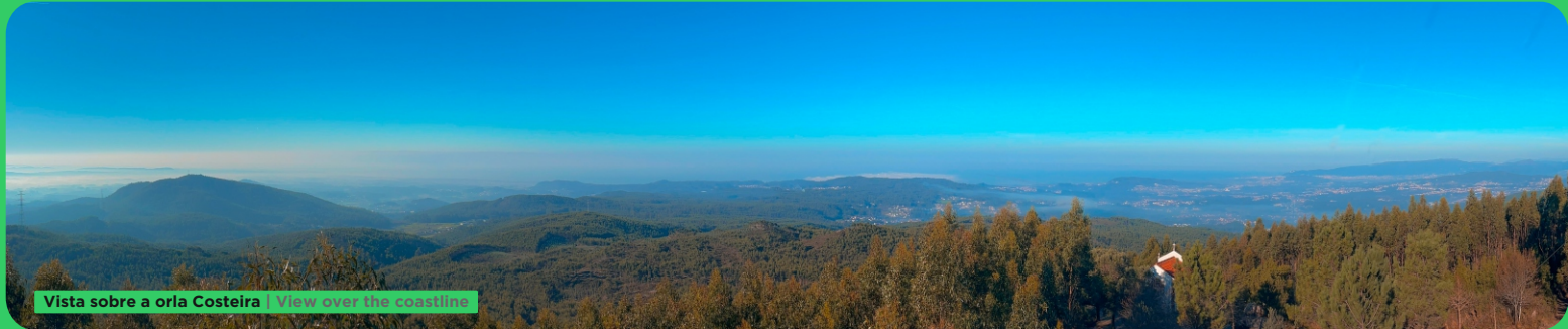
Vista sobre a orla Costeira | View over the coastline