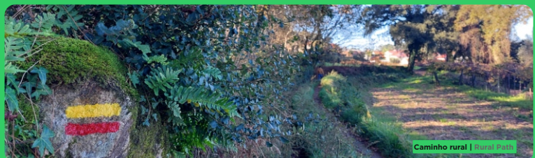
Caminho rural | Rural Path