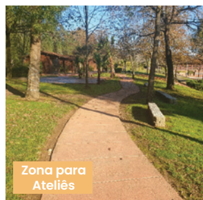
Zona para Ateliês