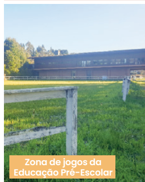
Zona de jogos da Educação Pré-Escolar