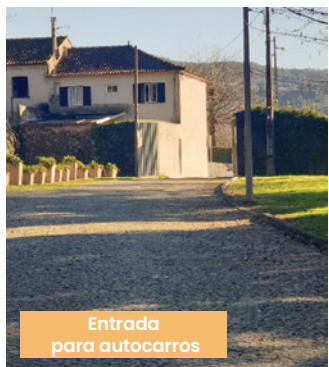
Entrada para autocarros