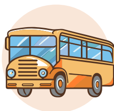
ESTACIONAMENTO DE AUTOCARROS