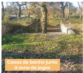
Casas de banho junto à zona de jogos