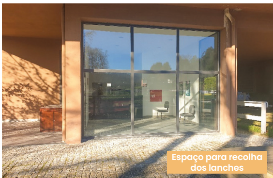
Espaço para recolha dos lanches