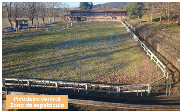
Picadeiro central Zona do espetáculo