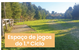
Espaço de jogos do 1.º Ciclo