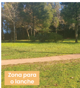
Zona para o lanche