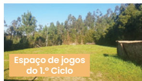
Espaço de jogos do 1.º Ciclo