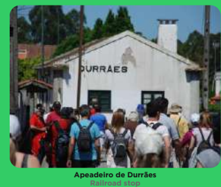
Apeadeiro de Durrães Railroad stop