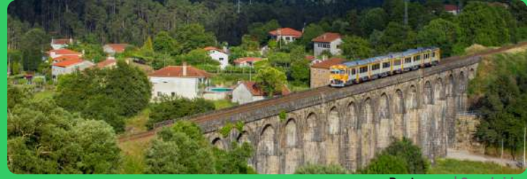
Ponte seca | Seca bridge