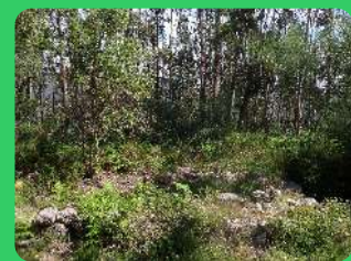
Picoto dos Mouros