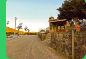
Capela de S. Miguel St. Michael's Chapel