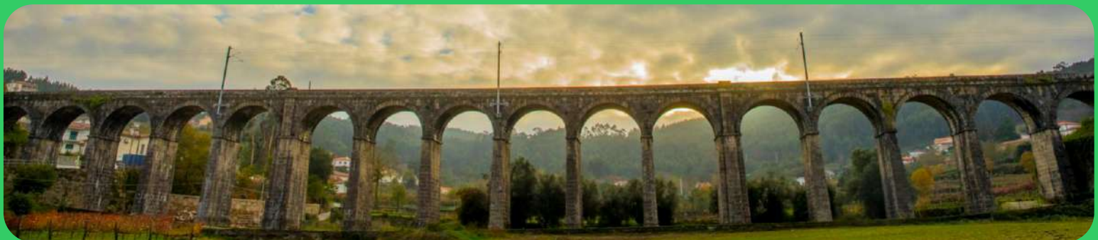
Ponte seca | Seca bridge