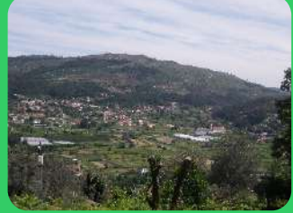
Vista sobre o Vale do Neiva View over the Neiva Valley