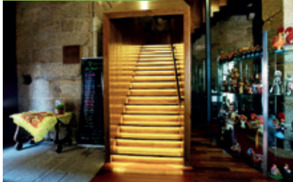
Entrada / Entrance / Entrée