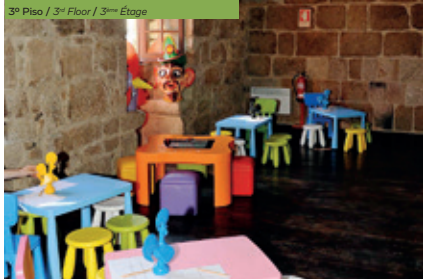
3º Piso / 3ª Floor / 3 ème Étage