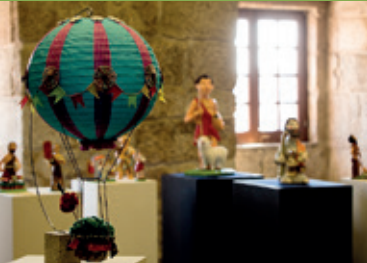
Exposições temporárias / Temporary exhibitions / Expositions temporaires