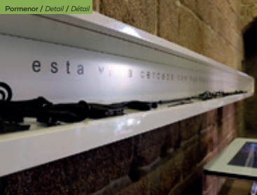
Pormenor / Detail / Détail