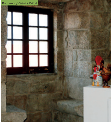
Pormenor / Detail / Détail