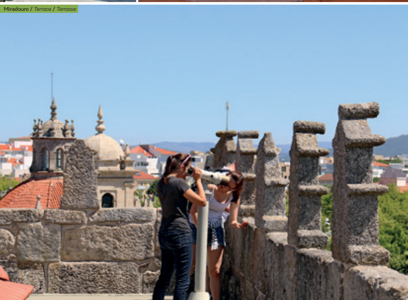
TORRE MEDIEVAL / TORRE DA PORTA NOVA