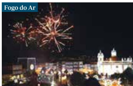
Fogo do Ar