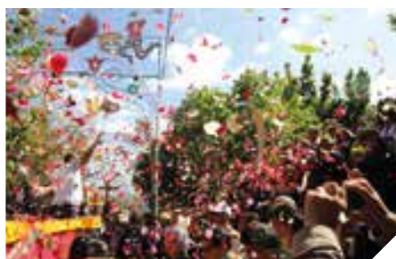
Rusgas ao Senhor da Cruz