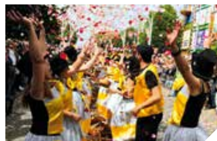
Folclore de Rua