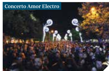
Concerto Amor Electro