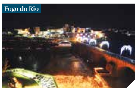
Fogo do Rio