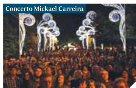
Concerto Mickael Carreira