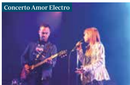
Concerto Amor Electro